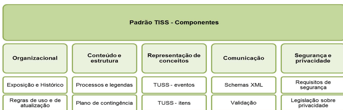
Figura 1 - Diagrama dos Componentes do Padrão TISS